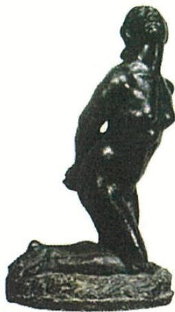
(問 9) 《女》