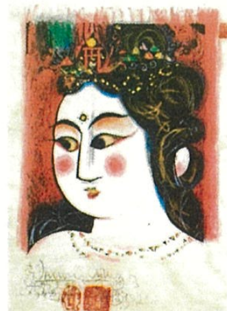
(問 10) 《弁財天妃の柵》