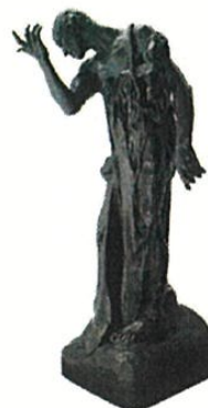
(問 20) 《ピエール・ド・ヴィッサン》